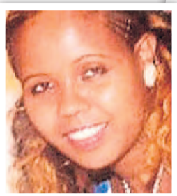
סלמלק טסרה ז"ל והשמלה שמשפחתה תרמה לתערוכה