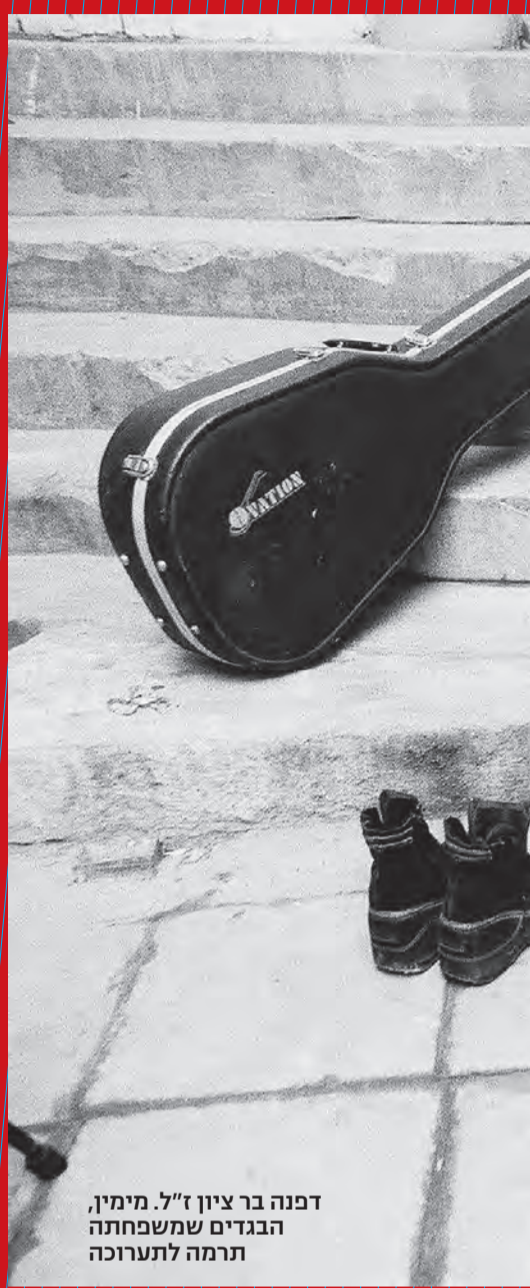
דפנה בר ציון ז"ל. מימין, הבגדים שמשפחתה תרמה לתערוכה